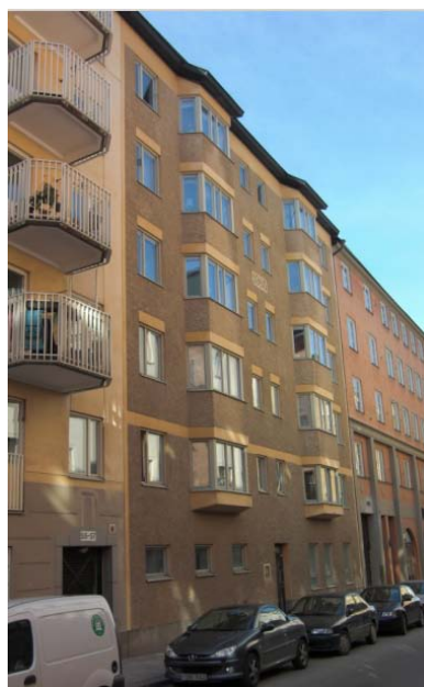
2. Brännkyrkagatan 57