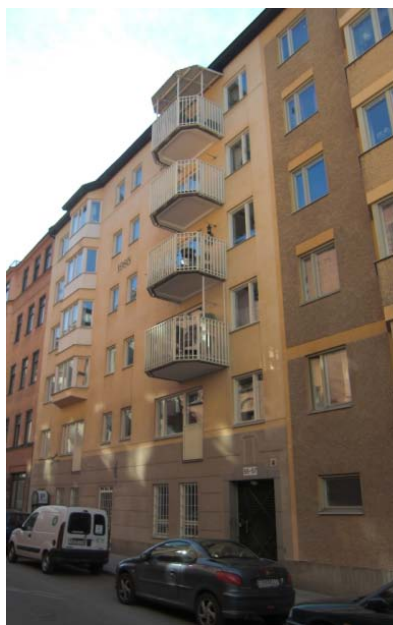
1. Brännkyrkagatan 55