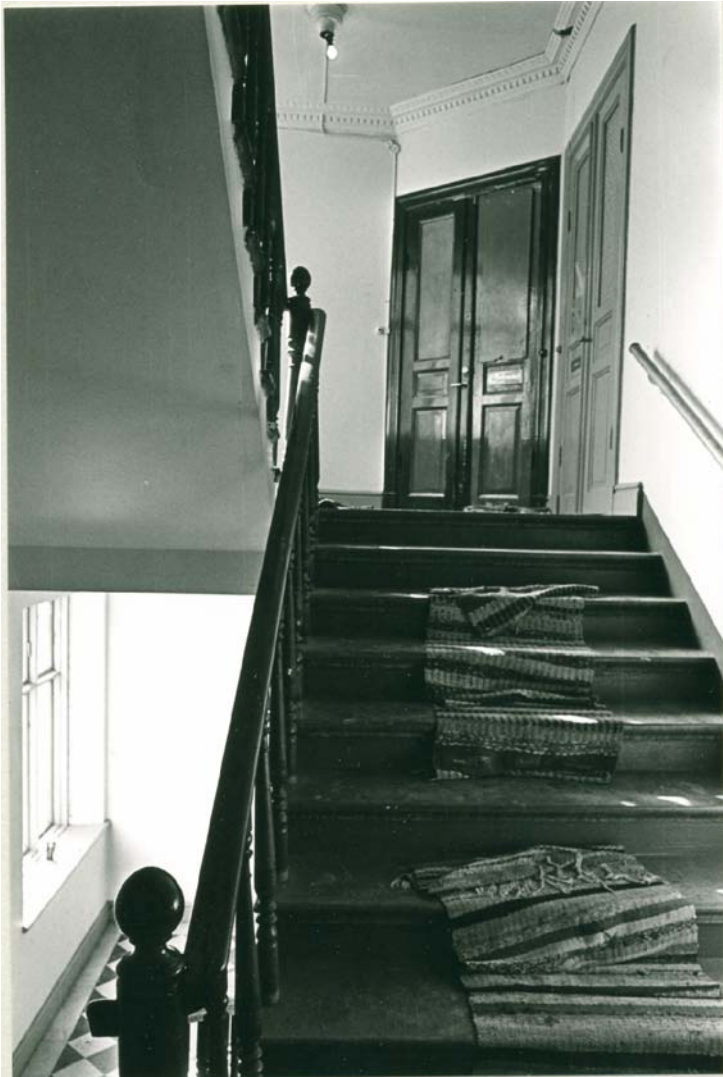
7. Brännkyrkagatan 57. Trapphuset. Foto Stockholms stadsmuseum, 1978, Fi 16246

Den slutliga rivningen ägde rum 1984 och ingick i ett större antal rivningar i de närliggande kvarteren. Staden hänvisade till dåliga grundförhållanden och sättningskador.