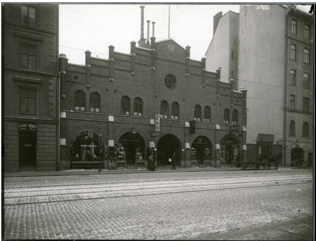
12. Maria saluhall, Hornsgatan 72. Foto 1912, Stockholms stadsmuseum D 7019.