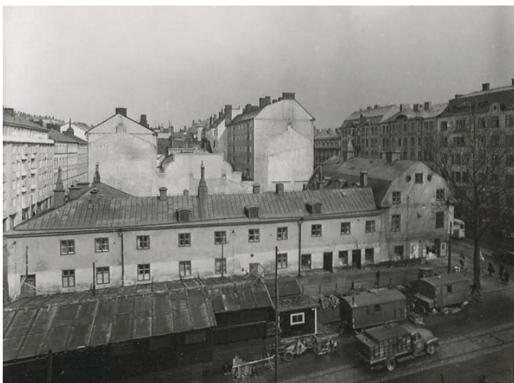
10. Kvarteret Gropen från väster. De låga 1700- och 1800-talshusen ersattes 1957 av den fastighet som idag inrymmer Hemköp. Foto (beskuret) Lennart af Petersens 1956, Stockholms stadsmuseum, F53618

I hörnet Hornsgatan/Torkel Knutssonsgatan/Brännkyrkagatan finns idag ett stort hus från 1957 som inrymmer bland annat Hemköp. I hörnet av Torkel Knutssonsgatan/Brännkyrkagatan ser man att fastigheten är indragen några meter på Brännkyrkagatan. Detta fenomen kan man se på flera ställen i staden, det vill säga att hus byggda på 1950- och 1960-tal ligger indragna några meter från äldre fastigheter. Det beror på att man planerade för den moderna staden med bredare gator, ljusare lägenheter och bättre framkomlighet för bilar.