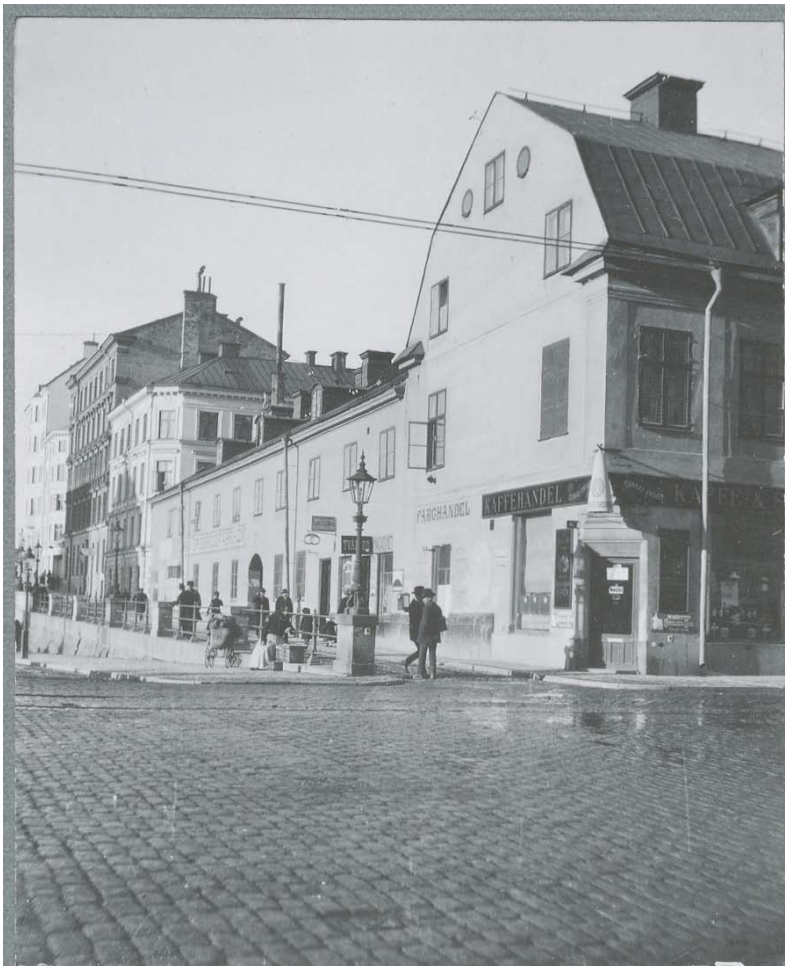
11. Fastigheten i Kvarteret Gropens västra sida på Torkel Knutssonsgatan med 1700-talshuset närmast till höger och 1800-talslängan där bakom. I detta hörn ligger idag entrén till Hemköp. Stockholms stadsmuseum, F 3735

Innan det stora kontors- och bostadshuset byggdes låg här ett hus från 1769 med fasaden ut mot Hornsgatan. 1807 byggdes det till med en länga längs med Torkel Knutssonsgatan (som då hette Skinnarviksgatan) och runt 1820 med en länga på Brännkyrkagatan. Fastigheten omfattade således hela västra delen av kvarteret Gropen. Fastigheten uppvisade en ganska typisk stockholmsmiljö från sent 1700-tal med både bostadshus och ekonomibyggnader. Föreningen Södermalm försökte hindra att de gamla byggnaderna revs och stadsantikvarien ville utreda om det inte vore möjligt att istället renovera byggnaderna, men Byggnadsnämnden beslöt att hela fastigheten skulle rivas.