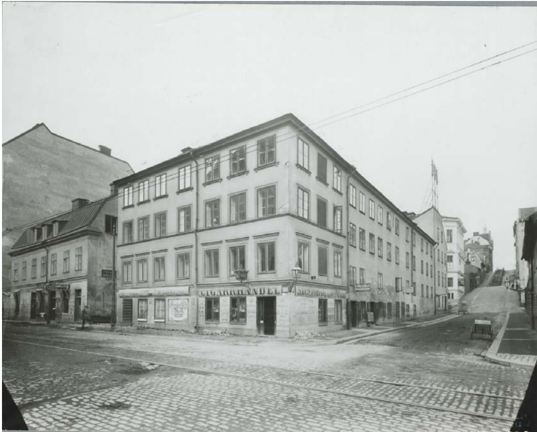
9. Hörnet Hornsgatan och Timmermansgatan. Här fanns en gästgivargård 1851-1876. Huset revs 1906.

I hörnet Hornsgatan/Torkel Knutssonsgatan/Brännkyrkagatan finns idag ett stort hus från 1957 som inrymmer bland annat Hemköp. I hörnet av Torkel Knutssonsgatan/Brännkyrkagatan ser man att fastigheten är indragen några meter på Brännkyrkagatan. Detta fenomen kan man se på flera ställen i staden, det vill säga att hus byggda på 1950- och 1960-tal ligger indragna några meter från äldre fastigheter. Det beror på att man planerade för den moderna staden med bredare gator, ljusare lägenheter och bättre framkomlighet för bilar.